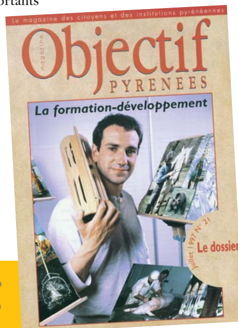
Le pupitre ariégeois est un exemple de valorisation de savoir-faire pyrénéen, valorisé par une formation développement ADEPFO.

dans les zones rurales ou de montagne (par exemple, maintien d'une école, d'un commerce ou de services publics).