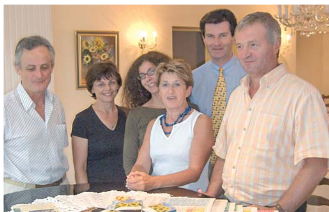
À Montclar-de-Quercy (82), l'hôtellerie du lac a été créée, lors d'une formation-développement ADEFPAT, grâce à un partenariat public-privé avec la commune.

Avec la politique des Pays, la formation-développement a trouvé son territoire d'action pertinent.