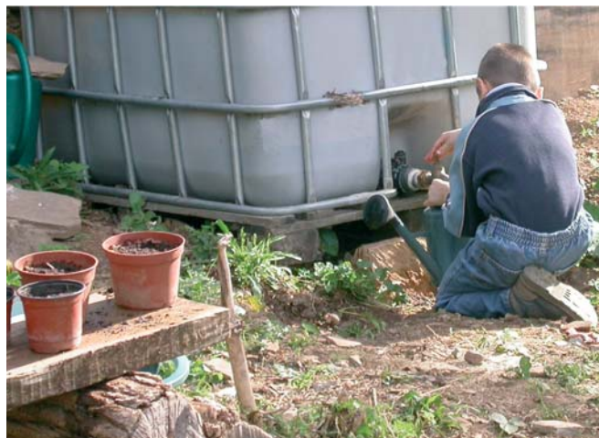
Dans le Tarn, huit structures d'accueil et d'éducation à l'environnement se sont engagées, grâce à une formation-développement ADEFPAT, dans une démarche concrète de développement durable.

L'objectif de la formation-développement n'est pas l'obtention d'un diplôme mais l'acquisition de compétences pour réussir dans une nouvelle activité ou dans le cadre de la pluriactivité. La pédagogie individualisée, qui se fait en face à face ou dans le cadre d'un groupe, est surtout dynamique. Elle est réalisée sur le lieu du projet. Elle est destinée à donner à la personne ou au groupe les moyens de faire émerger ou gérer son projet de façon autonome. Un appui est assuré pendant un certain temps pour permettre la montée en charge de l'activité.