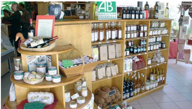
Grâce à des formations développement ADEPFO, une stratégie de développement agritouristique a été mise en place dans le Magnoac.

L'ADEPFO et l'ADEFPAT bénéficient du statut d'organisme relais entre les financeurs publics et les bénéficiaires de la formation, ce qui permet de débloquer les fonds dans les meilleurs délais.